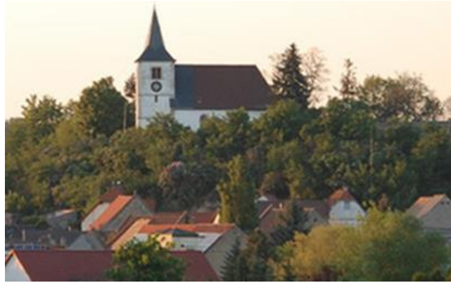
Die Bergkirche – der Stolz der Hillesheimer

Fast 120 Bürgerinnen und Bürger haben an der Umfrage teilgenommen – ein toller Erfolg –